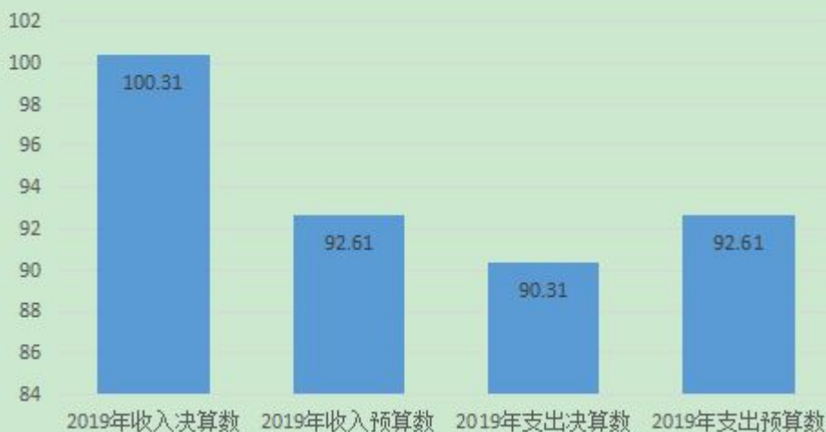
图 4: 财政拨款收支预决算对比情况