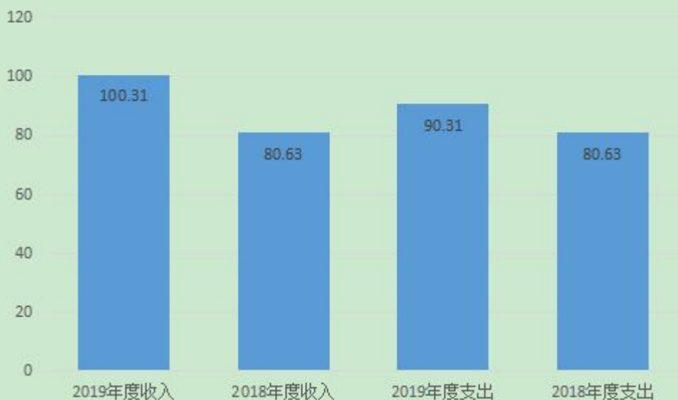
图 3:2018-2019 年财政拨款收支情况